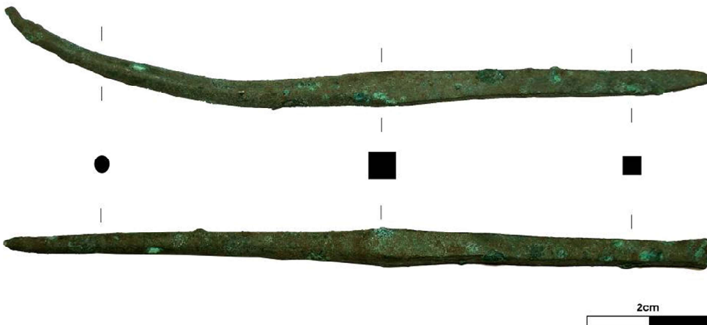
Bronzezeitliches Werkzeug (Schneidpfriem, Lesefund Mühlenstraße 2010) (2)

Die Görner Gemarkung ist reich an Fundplätzen. Aufgrund dieser Dichte wurden zwei Bodendenkmalgebiete im Ortskern ausgewiesen. Hier sollte vorsichtig und gewissenhaft bei Erdarbeiten darauf geachtet werden, dass es nicht unbeabsichtigt zur Zerstörung noch unentdeckter Zeugnisse der Vergangenheit kommt.